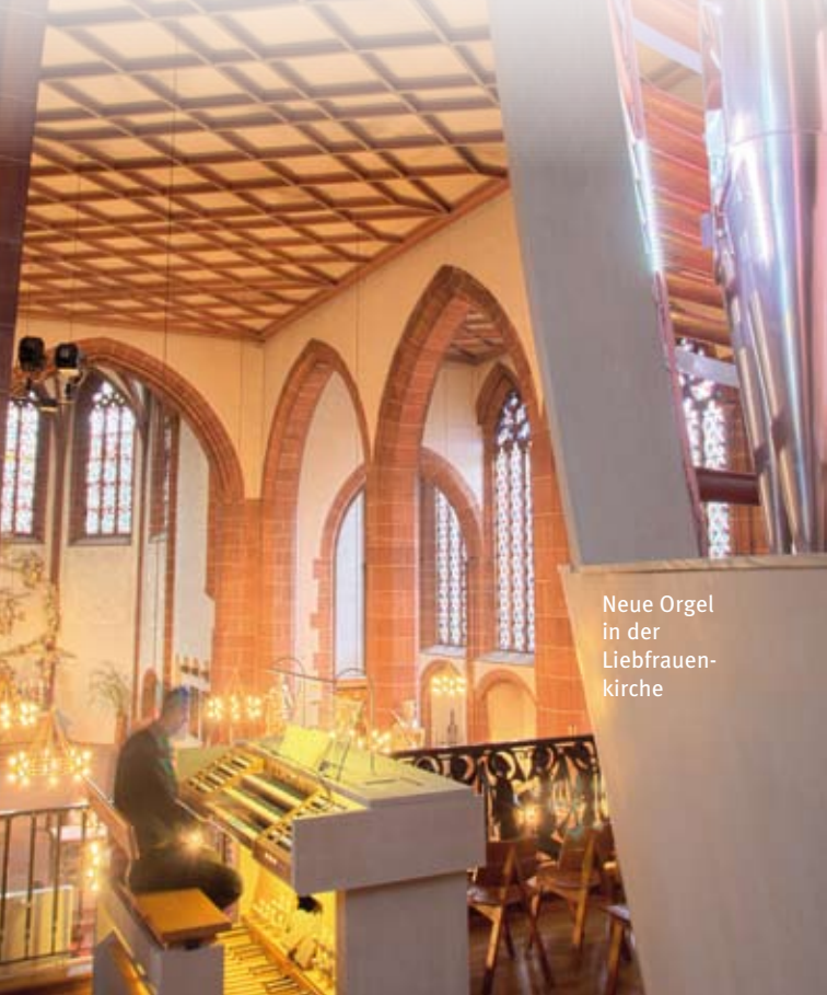
Neue Orgel in der Liebfrauen- kirche